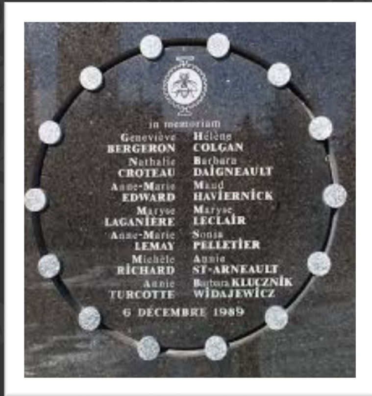
Memorium – Polytechnique

1983 : Les lois sur le viol sont modifiées pour inclure l'agression sexuelle et rendre pour la première fois le viol d'une femme par son conjoint une infraction criminelle.