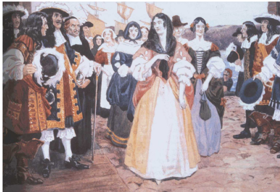
Filles du roi - 1667

1791 : La Loi constitutionnelle accorde le droit de vote à toute personne propriétaire y compris les femmes.