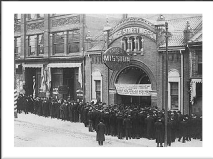
Food line at the Yonge Street Mission in Toronto in the 1930s (during the Great Depression)

1925 : La loi fédérale sur le divorce a été modifiée pour autoriser la femme à divorcer de son époux pour les mêmes raisons que ce dernier pouvait divorcer d'elle : simple adultère. Auparavant, les femmes devaient prouver qu'il y avait eu de la bestialité.