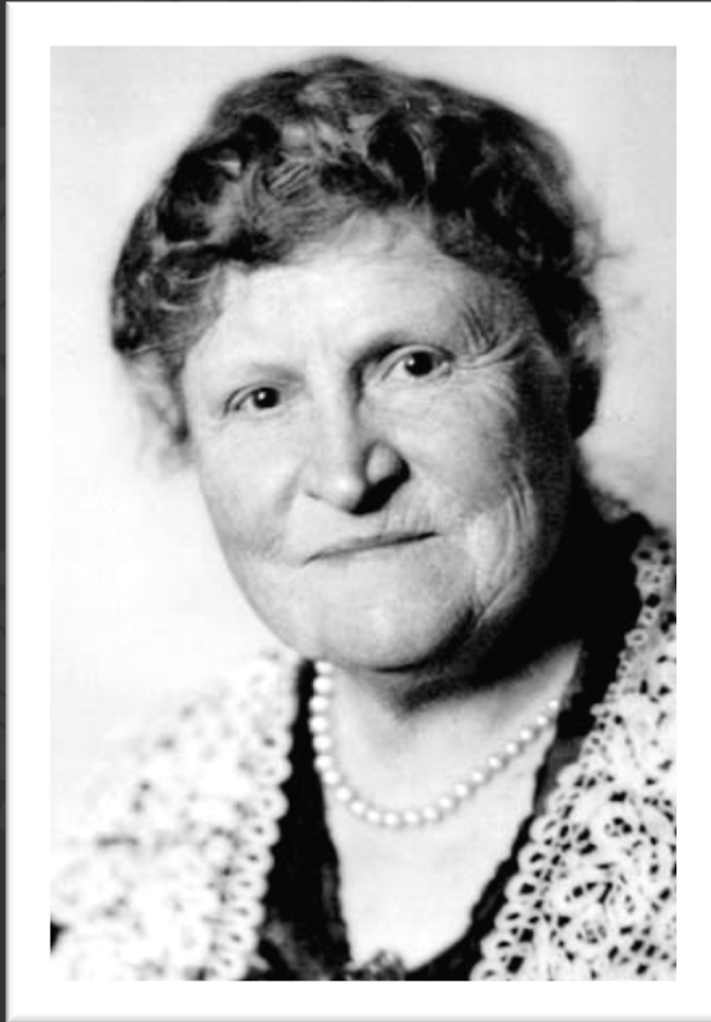
Henrietta Edwards (1849 – 1931) was a Canadian women's rights activist and reformer from Quebec. She was a member of the The Famous Five.

1849 : On interdit à toutes les Canadiennes , sans égard à la race, à la religion ou aux droits de propriété, de voter à n'importe quelle élection.