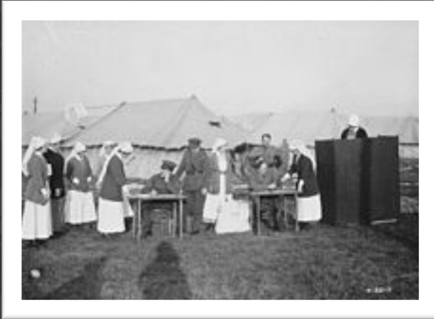
Nursing sisters at a Canadian military hospital in France voting in the Canadian federal election, 1917.

1909 : Le Code criminel a été modifié pour criminaliser l'enlèvement des femmes .